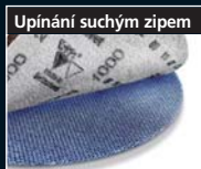
Upínání suchým zipem